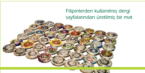
Filipinlerden kullanılmış dergi sayfalarından üretilmiş bir mat

Filipinler'den bir başka örnekteyse, altın madeninde çalışan kadınlarca yeniden üretime kazandırmak amacıyla kullanılmış eski dergilerden yapılan dekoratif matlar yer alıyor. Rulo yapılarak yüzey kazandırılan kullanılmış dergi sayfalarının bir araya getirilerek dikilmesiyle, son derece dekoratif ve kolay üretilen ürünler, ilginç bir örnek olarak hayranlık uyandırıyor.