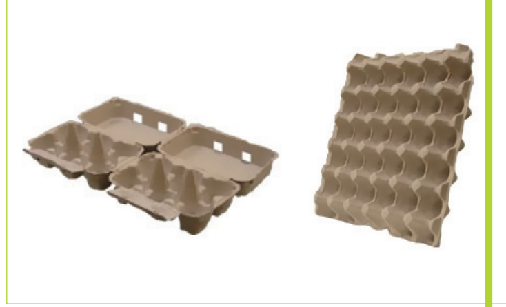
Kağıt hamurundan elde edilmiş endüstriyel ambalajlar

Diğer bir yaygın kullanım alanı da, atık kağıtların endüstriyel yöntemlerle kağıt hamuru olarak geri kazanılması sonucunda gündelik hayatta kullanılan pekçok ürünün ambalajı olarak değerlendirilmesi uygulamasıdır.