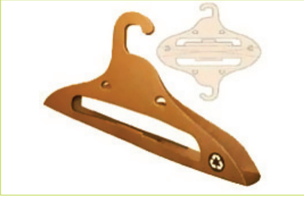
Rus tasarımcılar Alexey Chugunnikov ve Alexander Sekirash tarafından geliştirilmiş kağıt askı

Kağıt kullanımında sınırsızlığı zorlayan örnekler üzerinden devam ederken, bir Hint tasarımı karşımıza çıkıyor. Özellikle atık kağıtların yeniden kullanımını değerlendiren bu zanaat ağırlıklı çalışma, ev kadınlarına gelir sağlayacak bir olanak sunup kağıtların yeniden kullanımı konusunda çevreci bir yaklaşım sergiliyor.