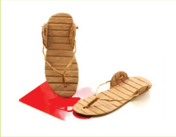
Geri dönüşümlü kağıt sandallar

Kağıt kullanımında sınırsızlığı zorlayan örnekler üzerinden devam ederken, bir Hint tasarımı karşımıza çıkıyor. Özellikle atık kağıtların yeniden kullanımını değerlendiren bu zanaat ağırlıklı çalışma, ev kadınlarına gelir sağlayacak bir olanak sunup kağıtların yeniden kullanımı konusunda çevreci bir yaklaşım sergiliyor.