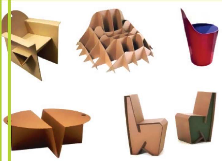
Ambalaj kâğıtlarından alternatif ürün çözümleneleri