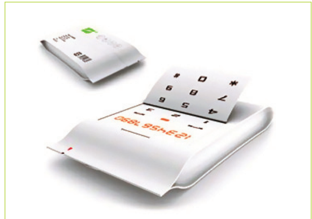
%100 geri dönüşümlü bir kağıt cep telefonu tasarımı

Ve gelecek! Kısıtlı kaynakların giderek artan bir şekilde kullanılmasının kaçınılmazı olarak tasarım ve teknoloji arayışlarını sürdürecektir, kaynakların en ekonomik ve yaratıcı şekilde kullanılması çabasını genişleterek gündelik yaşamımızdaki pekçok ürünün alternatifleriyle yakın dönemde buluşmamızı sağlayacak gibi gözüküyor. Son çarpıcı örneğe, çok yakında karşımıza çıkması beklenen bir kağıt telefon ürünümüz. Belki de yakın bir gelecekte telefonlarımızın kağıttan olabileceğini düşünebiliyor muyuz?